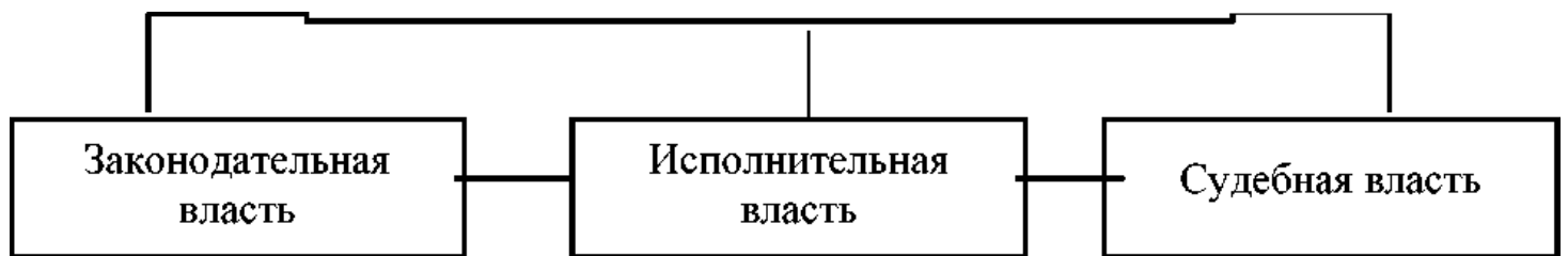
Рисунок 1. Система структуры государственного аппарата Российской Федерации

Однако, как показывает исторический опыт, реализация подобной концепции приводит не в демократии, а к диктатуре. Об этом свидетельствует, в частности, политическая практика фашистской Германии, Италии и ряда иных стран.